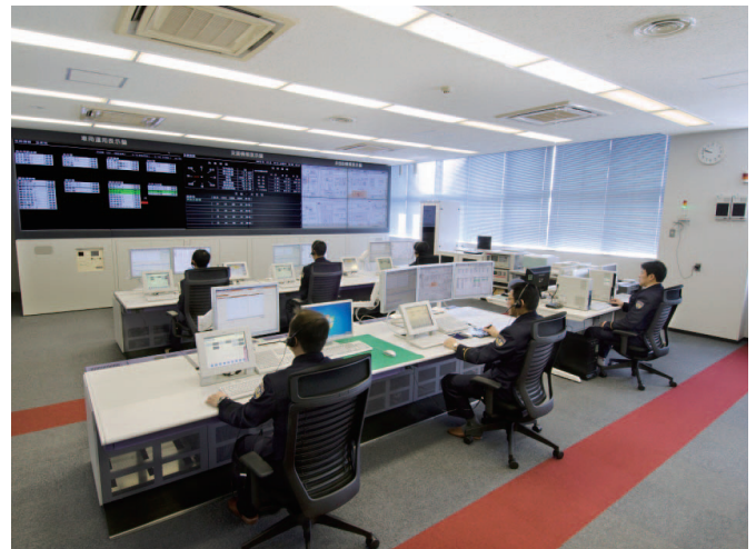
志太消防本部通信指令センター

県では、平成20年3月に県内を東部・中部・西部の3圏域3指令とする「静岡県消防救急広域化推進計画」を策定しました。その後、圏域ごとの対象市町による広域化に関する協議の結果、焼津市と藤枝市は住民の生活圏