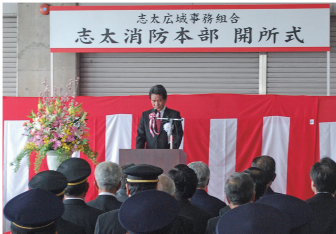
焼津市中野市長（組合構成市）