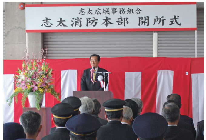
藤枝市北村市長（組合構成市）

平成25年3月31日に「志太消防本部」が誕生しました。静岡県内で初の広域化が実現したわけではありますが、これには、両市長の英断と議会の理解が得られたからこそのものであると実感しています。